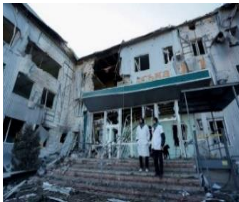
Sykehus og helsestasjoner er ødelagt.

Gjennom to års samarbeid med Lviv International Rotary Club, har norske rotaryklubber bidratt med medisinsk utstyr for flere millioner kroner. Det er levert mer enn 500 generatorer som drifter både sykehjem, barnehjem, skoler og private hjem. Vår ambisjon er å skaffe tilveie 100 mobile nødhjelpsklinikker som skal operere i frontnære områder hvor normal helsehjelp ikke lenger finnes.